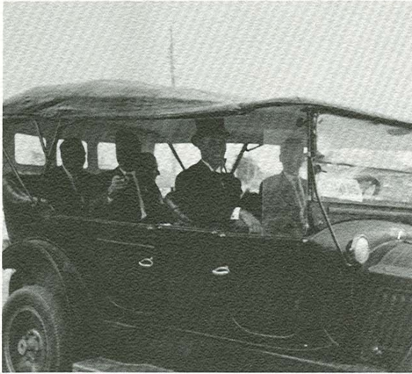
Voiture des conseillers