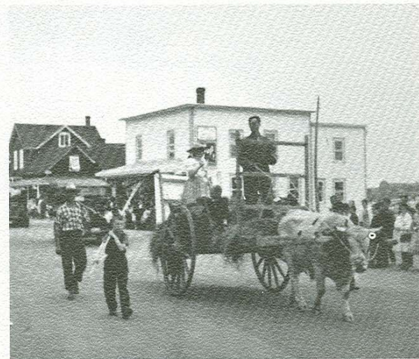
Boeuf attelé à la charette