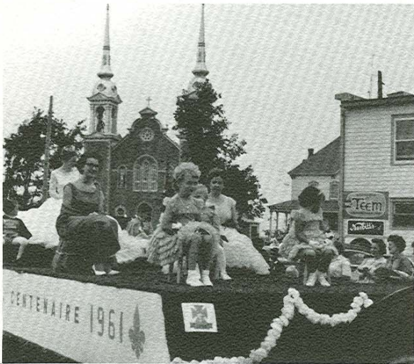
Cortège de la Reine