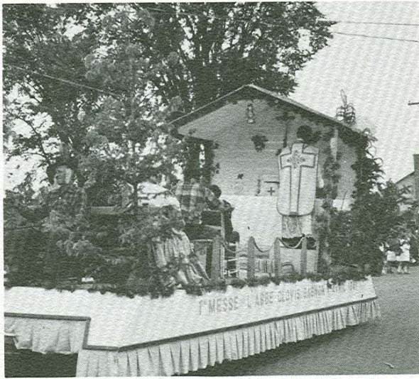
1 ère messe, abbé Clovis Gagnon, missionnaire