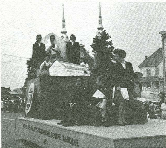
Oblates de Marie-Immaculée