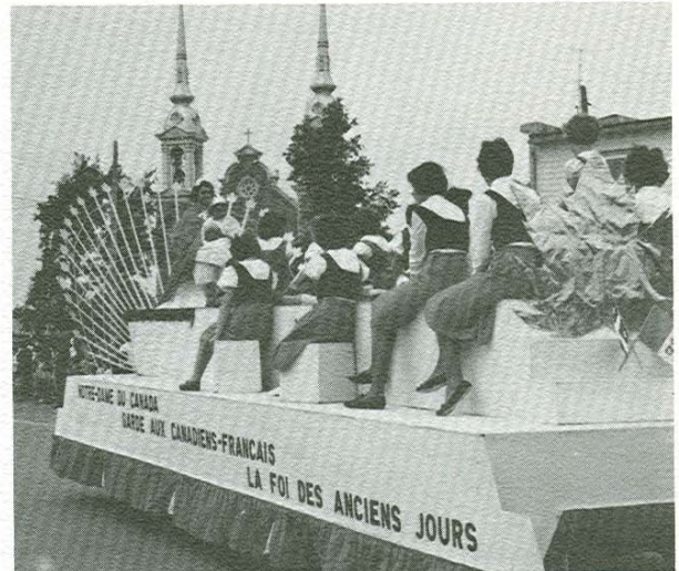
Notre-Dame du Canada garde aux Canadiens Français La Foi des Anciens Jours.