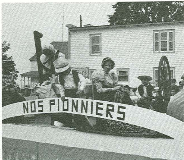
Travaux des anciennes