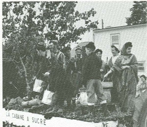
Fête à la cabane