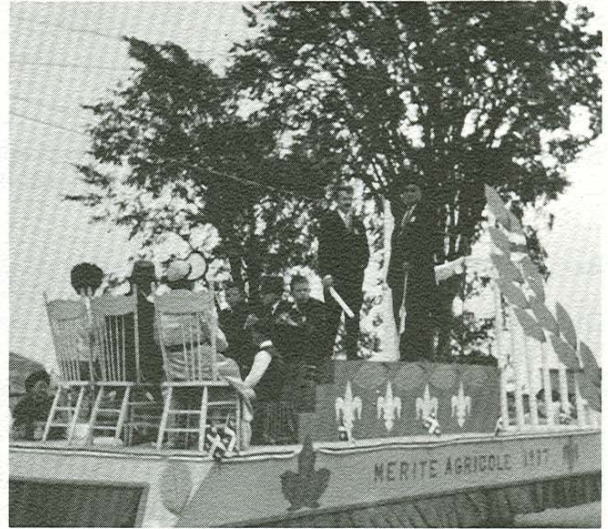
Mérite agricole 1937