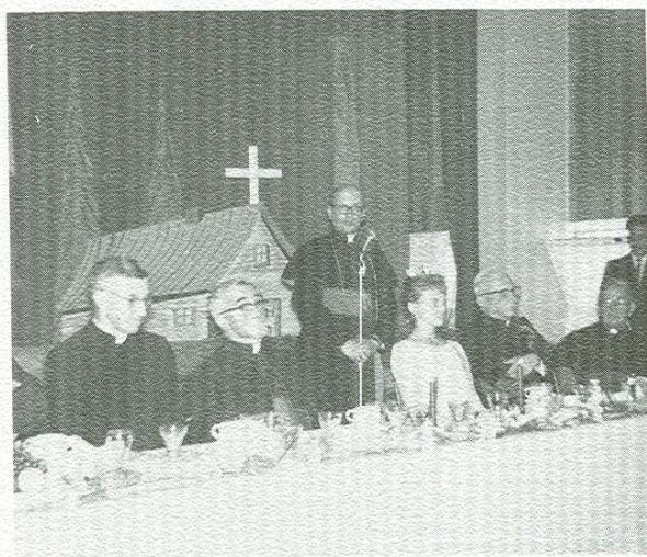
Banquet du Centenaire