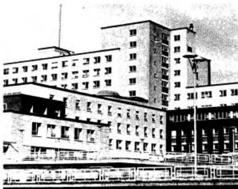
L'hôpital de 1967.

Avant de tourner la dernière page de cette année 1967, voici un relevé des activités, tiré du rapport HS-1 de cet hôpital, qui n'a cessé d'accroître les services rendus à la population, tout en parachevant les travaux de la construction.