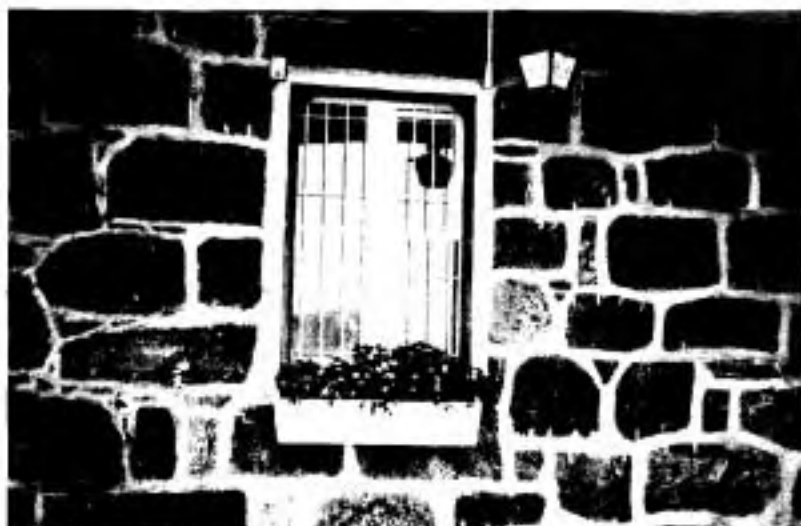
Les pierres de l'hôpital de 1885.

autre à l'Hôtel-Dieu d'Arthabaska. Ces locaux sont situés dans l'hôpital de 1885; la porte d'entrée actuelle a remplacé une fenêtre qui voisinait les deux autres de cette époque, facilement identifiables dans le sousbassement solide de pierres des champs qui constitue la façade de la Fraternité. Les Hospitalières de la Fraternité s'honorent d'occuper la partie la plus historique du premier hôpital, sauvée des démolitions successives survenues au cours des cent dernières années.