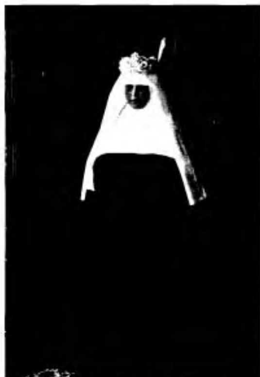
Une novice le jour de la prise d'habit.