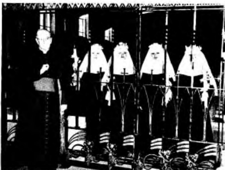
La dernière prise d'habit à Arthabaska, 16 mai 1949.

De 1884 à 1949, 373 postulantes ont été inscrites au registre des admissions. Si on considère qu'en mai 1949, la Communauté locale compte 115 membres et qu'il y a eu 49 décès pendant la même période, on peut conclure qu'un peu moins de 50% ont persévéré dans la vie religieuse.