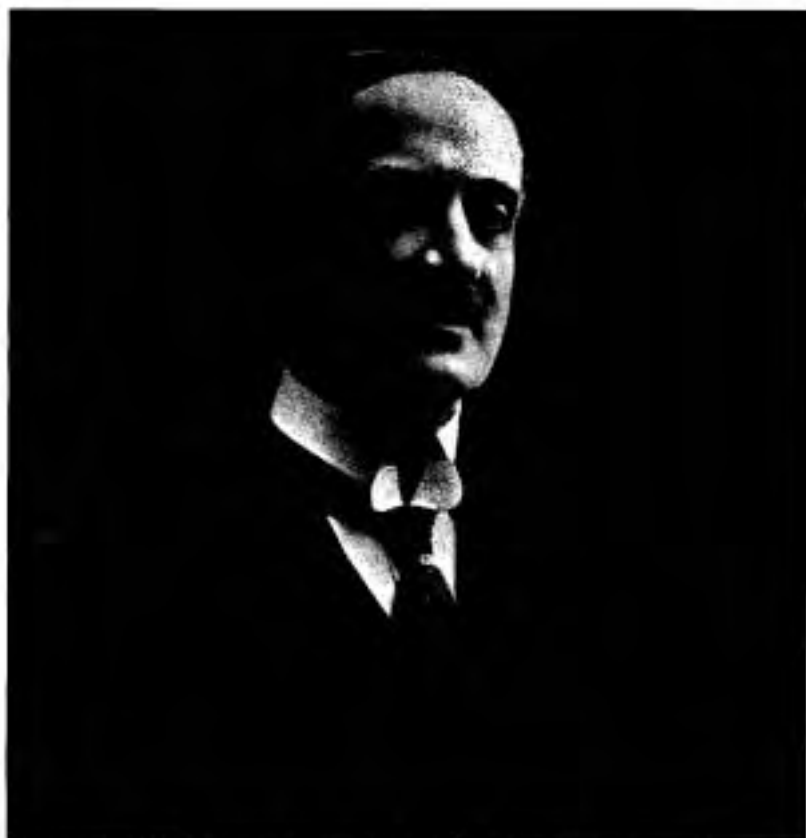
L'Honorable J. E. Perreault, ministre de la Voirie du Québec, 1929.