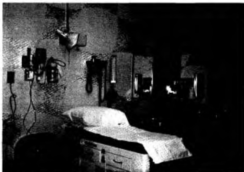
Une salle de consultation à l'urgence, 1982.

En 1982, avec l'accord de toutes les instances concernées, le Conseil d'administration décrète comme priorité numéro 1 la réorganisation du service d'urgence. L'ouverture officielle des nouveaux locaux, pourvus de toutes les installations modernes, a lieu le 13 décembre 1982 à la grande satisfaction des bénéficiaires, des médecins et du personnel soignant. Une attention particulière y a été apportée au niveau de l'accueil, de l'intimité des bénéficiaires et des familles, le tout dans un continuum fonctionnel des soins dispensés par l'équipe soignante.