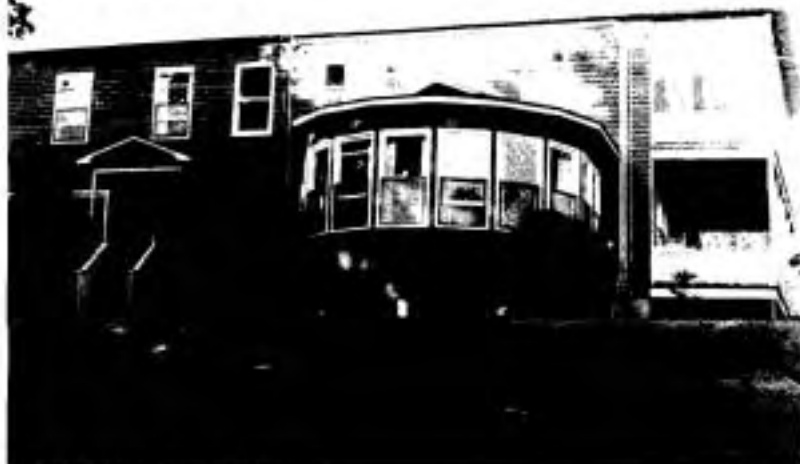
Le chalet de la "montagne", 1956.