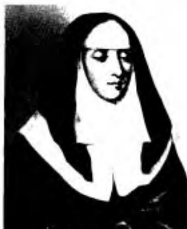
Jérôme Le Royer de la Dauversière et Marie de la Ferre, fondateurs de l'Institut des Religieuses hospitalières de St-Joseph, à Laflèche, en 1636.

En 1630, à La Flèche, en France, Jérôme Le Royer de la Dauversière reçoit de Dieu, dans une vision surnaturelle, l'ordre de fonder une congrégation religieuse pour l'établissement d'un hôpital sur l'île de Montréal. Monsieur Le Royer est un mari dévoué, père de cinq enfants, collecteur de taxes pour sa ville. Il se caractérise par sa foi en Dieu et son amour des pauvres et des malades. Il fonde sa communauté des Religieuses Hospitalières à La Flèche en 1636 et en 1642 il fonde Ville Marie, alors que Jeanne Mance y établit l'Hôtel-Dieu.