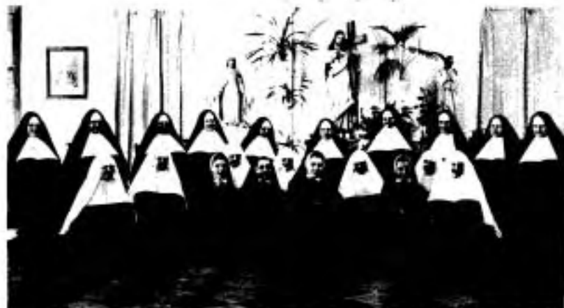
Les novices et postulantes d'Arthabaska avec le Conseil général à Montréal, août 1949.

"Tout comme pour les plantes que l'on enlève de terre, quelques fibres se sont douloureusement brisées au cours de la transplantation; mais l'accueil si cordial de leur nouvelle famille religieuse et les multiples attentions dont elles sont l'objet auront tôt fait de rasséréner les esprits et les cœurs!"(2)