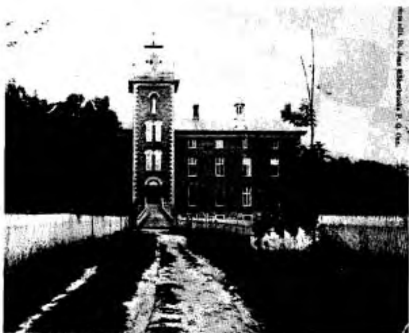
L'hôpital en 1885. Louis Caron, architecte.

Le 11 janvier 1886, apporte une double joie,