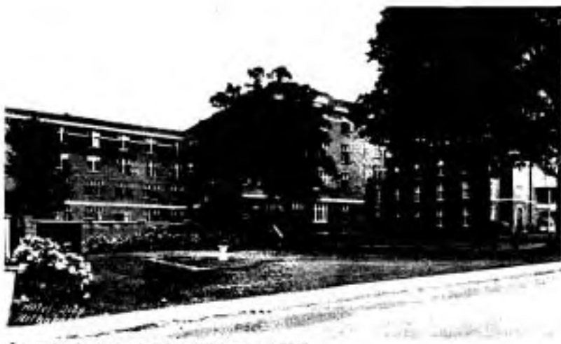
À gauche, le monastère des religieuses, en 1938.

Et la paix du soir étend sa quiétude sur la fin de ce jour de fête en date du 21 juin 1938, laquelle date sera inscrite en lettres d'or dans nos annales monastiques.