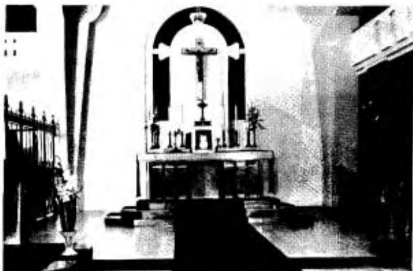
La chapelle des R.H.S.J. rénovée en 1959 selon les plans de l'architecte D. Deshaies.

L'autel est placé au centre du sanctuaire, faisant face aux fidèles; on y installe des bancs modernes et plus confortables au chœur des religieuses. La peinture est entièrement renouvelée de même que les fixures électriques, ce qui donne à la nouvelle chapelle un aspect tout à fait agréable, pieux et reposant." (1)