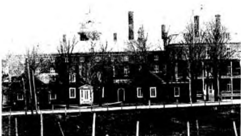
L'Hôtel-Dieu en 1908.

Le 19 juin 1908 se détache en caractères brillants: cette date ouvre la première page de l'histoire de cet hôpital, attendu depuis bientôt un quart de siècle.