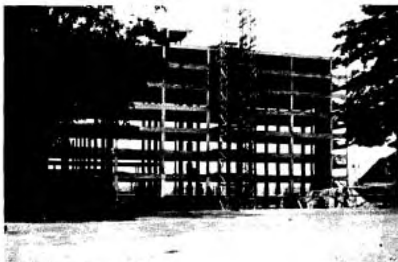
La construction de l'hôpital en 1961.