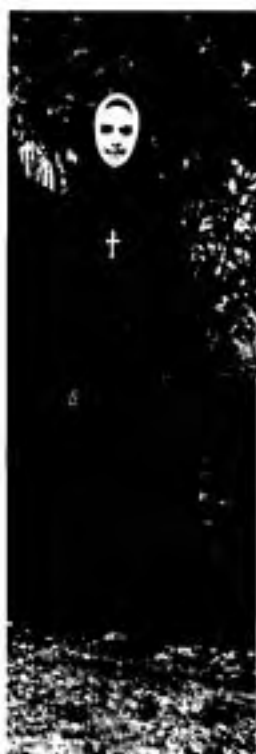
Une soeur tourière en 1906.

canonique du noviciat ne permettant aucune profession perpétuelle. En conséquence, au mois de décembre précédent, lors d'une visite à l'Hôtel-Dieu où, avec émotion, Monseigneur de Nicolet encourage les soeurs à continuer leur vie de sacrifices que Dieu ne peut manquer de bénir, il a permis à ces deux novices de faire profession temporaire, comme soeurs tourières.