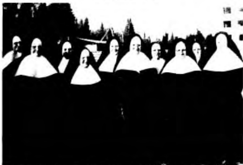
1ère rangée, les fondatrices de Saint-Jérôme, 11 octobre 1949.

Les travaux de construction vont bon train et, dès le 11 octobre 1949, un premier groupe de six soeurs quittent Arthabaska pour Saint-Jérôme. On les désignera comme les fondatrices, bien que Mère Thibault en restera la supérieure-fondatrice, cette nomination remontant au 14 septembre 1948. On se rappellera que le 5 mai 1949, Mère Thibault est devenue 1re Conseillère du Généralat montréalais. Ces six religieuses fondatrices de Saint-Jérôme sont: