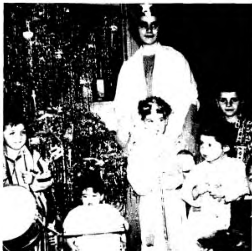
Noël à la pédiatrie, 1960.

Chaque année aussi, la fête de Saint-Joseph réunit au 19 mars les religieuses, le personnel et les étudiantes dans une commune dévotion au titulaire de l'Hôtel-Dieu.