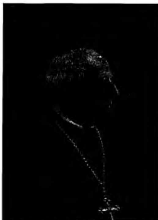
Mgr L.-S. Frs. Laflèche, évêque des Trois-Rivières en 1884.

Le vénéré Mgr Laflèche dont la charité et la bonté proverbiales avaient fait leurs preuves dans les lointaines missions sauvages aussi bien que dans les sollicitudes de sa charge épiscopale, lui envoie, dès le lendemain, premier août, le témoignage non équivoque de sa satisfaction.