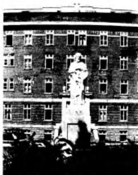
La statue de St-Joseph de 1885.