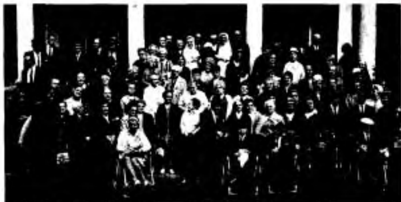
À l'Ermitage St-Joseph, au départ pour Notre-Dame-du-Cap.