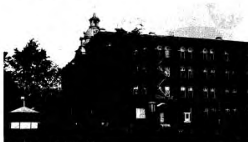
L'Ermitage Saint-Joseph en 1952.