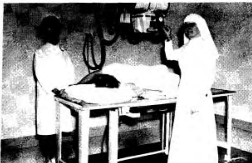
À l'école de technologie radiologique en 1964.

Les hôpitaux de région souffrent, pendant de longues années, de la pénurie de cette main-d'oeuvre spécialisée et la meilleure façon de corriger cette situation est d'ouvrir, comme plusieurs autres hôpitaux du Québec le font à cette époque, sa propre école de technologie radiologique.