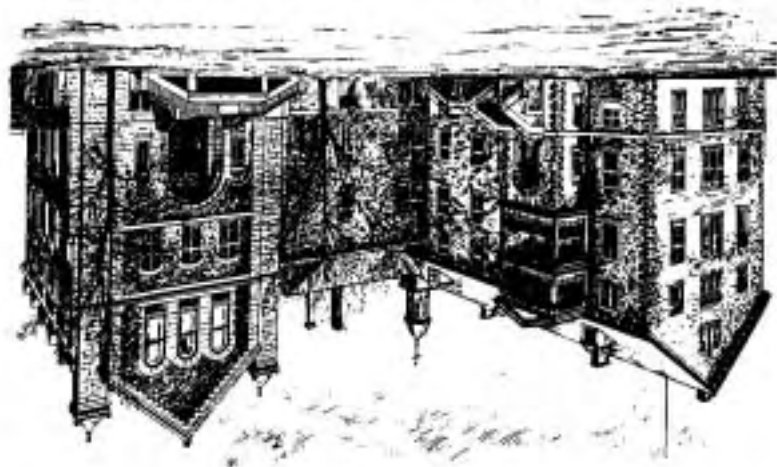
L'Hôtel-Dieu de Montréal (en 1882), berceau de l'Hôtel-Dieu d'Arhabaska.