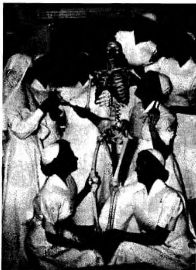
Les 8 premières étudiantes infirmières, août 1953.

Un article du Journal L'Union des Cantons de l'Est de l'été 1953, adressé aux amis de l'éducation, souligne en ces termes l'ouverture prochaine de l'École des infirmières: