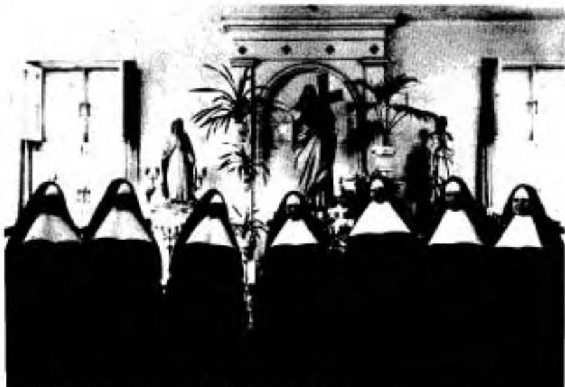
Le Généralat montréalais, 1er Conseil général, 1949.