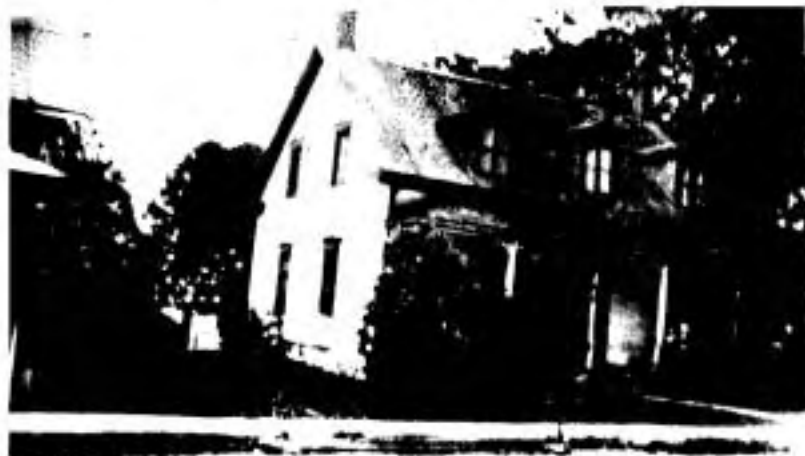
"Nazareth", première maison des soeurs en 1884.

Nazareth possède en propre les effets requis pour le culte divin, certains remèdes indispensables à une pharmacie et les articles de