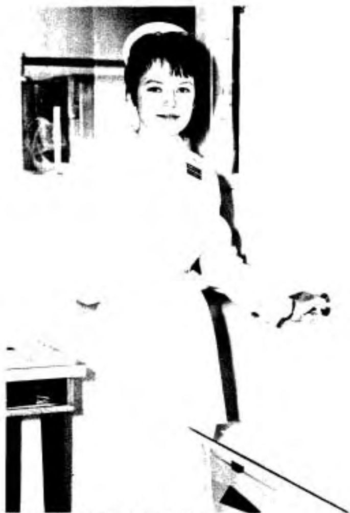
L'arrivée des professionnels de la santé, 1963.