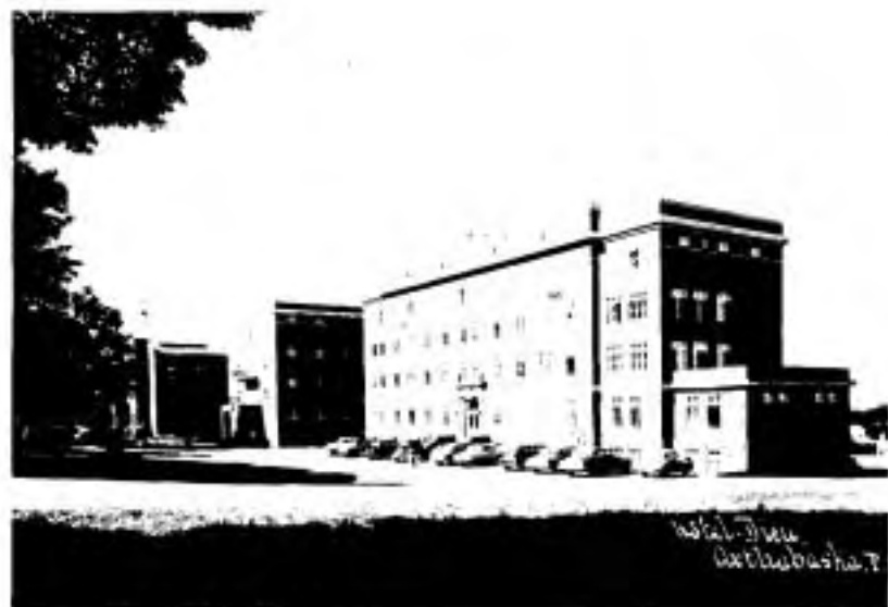
Le nouvel hôpital de 1931, à droite.

“M'en rapportant au jugement et à la sagesse de monsieur le Chanoine, curé, et des membres du Chapitre, j'approuve jusqu'à nouvel ordre et je sanctionne la susdite Résolution capitulaire.”