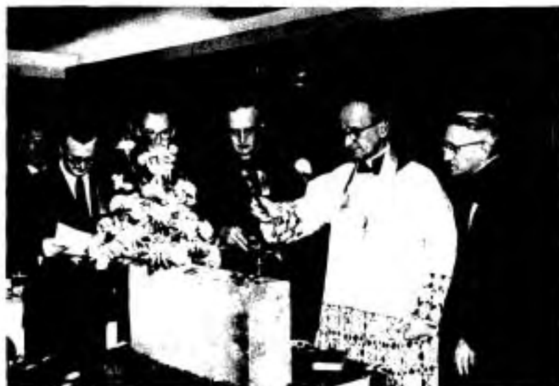
La bénédiction de la pierre angulaire, 5 décembre 1959.