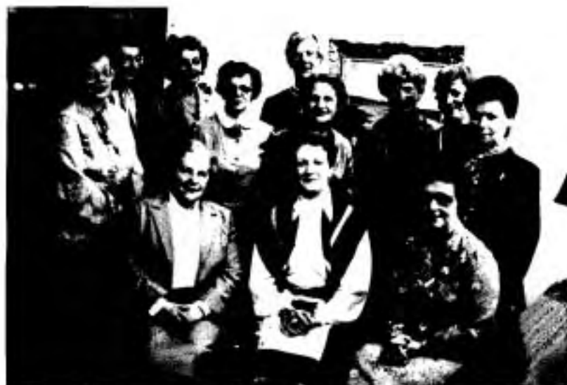
Le Conseil d'administration des Bénévoles en 1983.

Voici donc brièvement les principales interventions axées sur l'ouverture de l'hôpital à la communauté depuis l'étude de ce rapport en 1979: