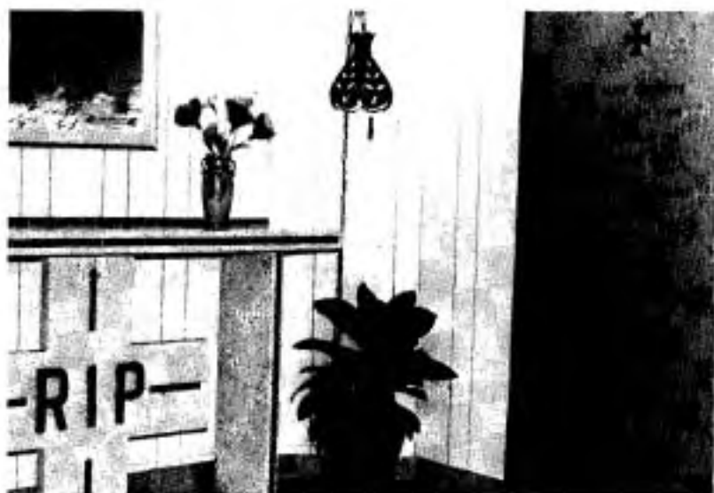
La crypte des Religieuses.

Elles reposent dans la crypte, où il nous fait bon de penser que depuis le premier départ pour la patrie céleste en 1901, petit à petit, la Communauté de la terre va rejoindre celle qui se forme autour du Seigneur, parmi ceux et celles qui, en son nom, ont donné à boire un verre d'eau à celui qui avait soif et pansé celui qui était blessé.