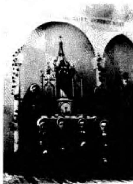
Les postulantes d'août 1943.