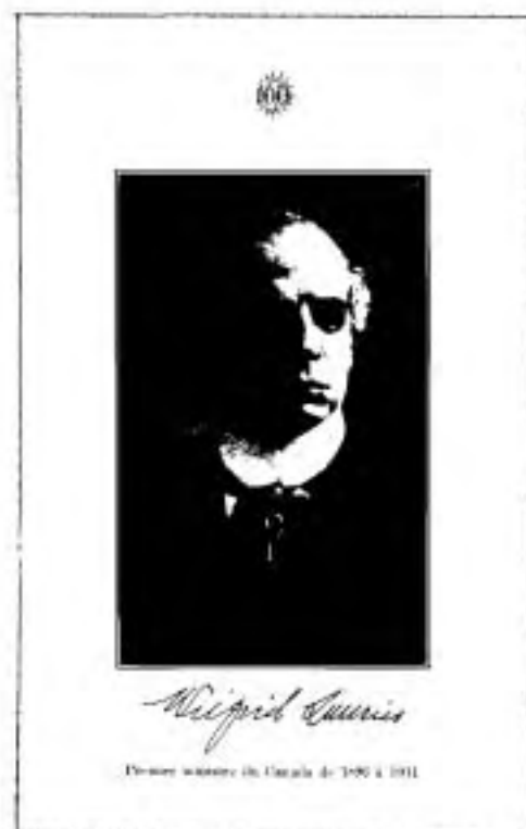
Centenaire d'Arthabaska, 28 juin au 2 juillet 1951.