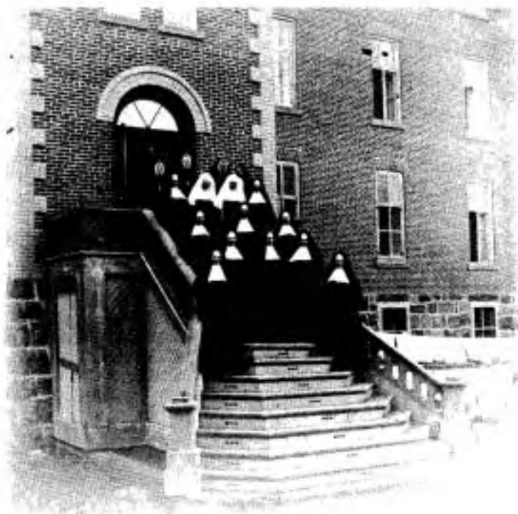
Un groupe de R.H.S.J. vers 1900.

La liste des offices d'alors donne un total de 15 religieuses, dont 8 soeurs de chœur, 5 soeurs converses, 1 soeur tourière et 1 postulante choriste. De ces quinze religieuses, il reste quatre des fondatrices de 1884. On y compte aussi Soeur Saint-Raphaël (Corinne Quesnel), première professe d'Arthabaska. Soeur Victorine constitue la première soeur tourière.