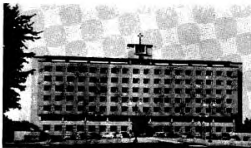
L'Hôtel-Dieu de Saint-Jérôme, ouverture en 1950.

L'ouverture officielle de l'Hôtel-Dieu de Saint-Jérôme(1) a lieu le 3 décembre 1950 par l'admission de ses premiers hospitalisés. L'Hôtel-Dieu d'Arthabaska sacrifie, dans les années qui suivent, ses propres religieuses pour prêter assistance dans ce nouveau champ d'activités. De 1948 à 1976, date de la fermeture de la résidence des religieuses de Saint-Jérôme, 34 soeurs d'Arthabaska ont oeuvré à l'Hôtel-Dieu de Saint-Jérôme, pour plusieurs d'entre elles, pendant de nombreuses années.