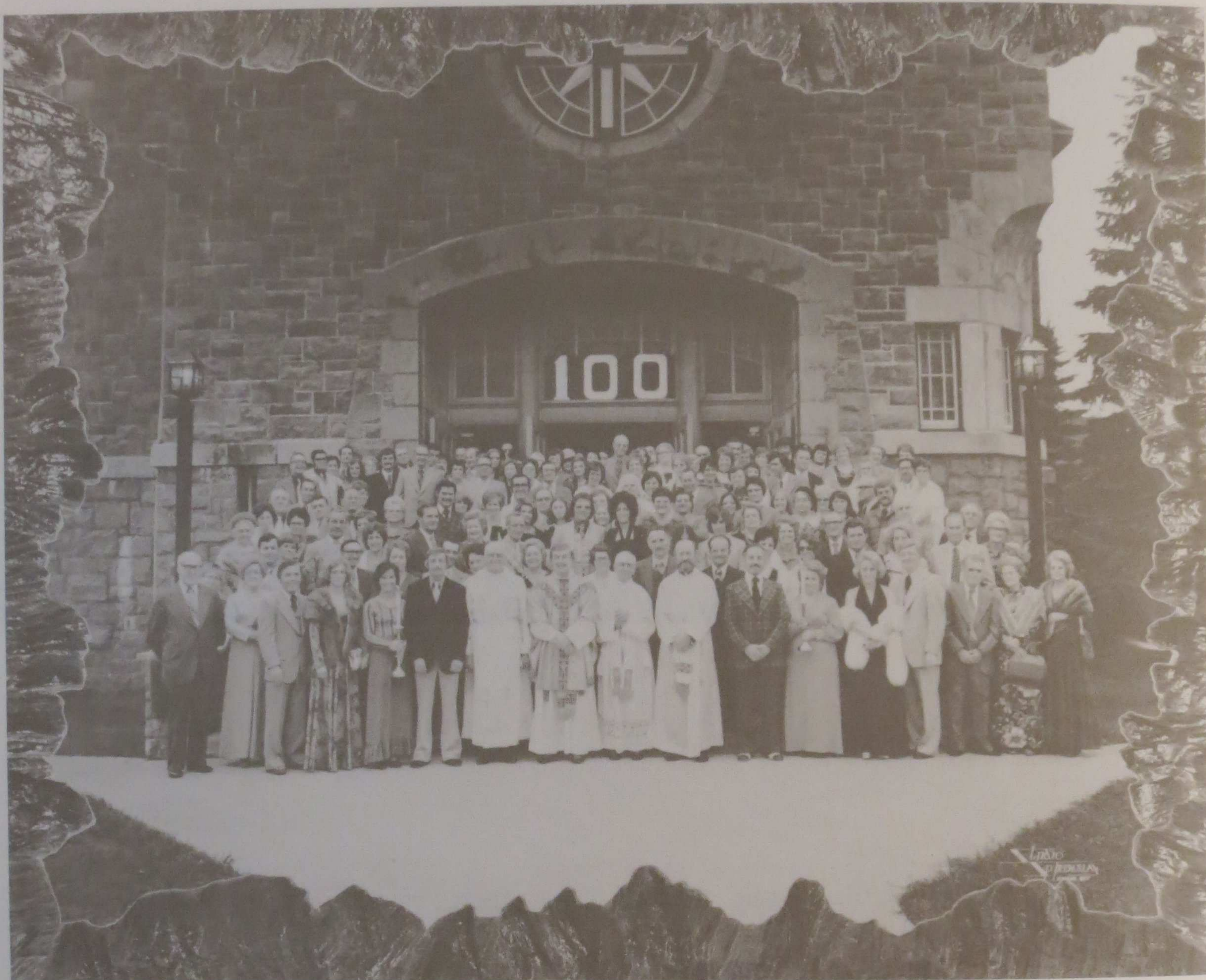
Photo-souvenir prise à l'issue de la messe solennelle célébrée à l'occasion du Centenaire de Saint-Lazare.