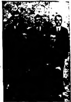
MEMBRES DU BUREAU DE DIRECTION

La conclusion, c'est que si les cultivateurs du Québec imitent cet exemple, les problèmes de la classe agricole seraient vite réso- lus.