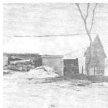
Première scierie (1890 à 1970) fonctionne à l'eau