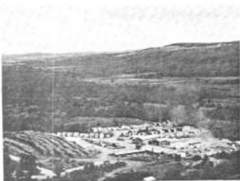
Le moulin tel qu'il apparaît en 1981, incendié le 19 septembre 1981

Un an plus tard, la reconstruction débuta et on améliora la disposition des machineries pour une plus grande efficacité tout en améliorant le bien-être des travailleurs. L'usine est aussi pourvu d'un système de gicleurs automatiques.