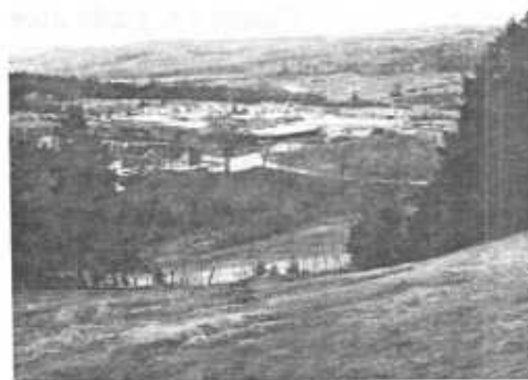
Scierie Clermond Hamel Ltée, construit en 1983

L'usine produit maintenant 25 000,000 pieds de bois annuellement avec cinquante-cinq hommes. Autres fait à noter, l'usine est entièrement équipée de machineries fabriquées par l'Industrie P.H.L. Inc.