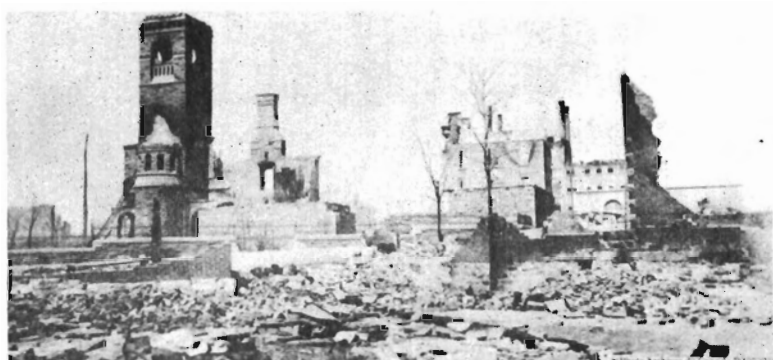
La rue Principale présentait cet aspect de désolation après la conflagration de 1900.

En mars 1891, plusieurs marchands de Hull envoyaient au Conseil de ville une pétition demandant qu'on interdise la circulation des tramways d'Ottawa dans nos rues car, prétendait-on, leur présence porteraient un grand préjudice au commerce local.