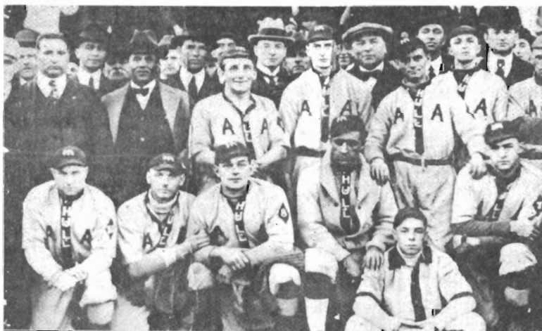
En 1919, le club de Hull battait celui d'Ottawa-Est pour le championnat interprovincial.

C'est Lord Minto, Gouverneur général de 1893 à 1898, qui mit ce sport à la mode au pays. L'Ottawa Ski Club fut le premier du genre au Canada. Le club avait une glissoire au Lac des Fées, à Hull.