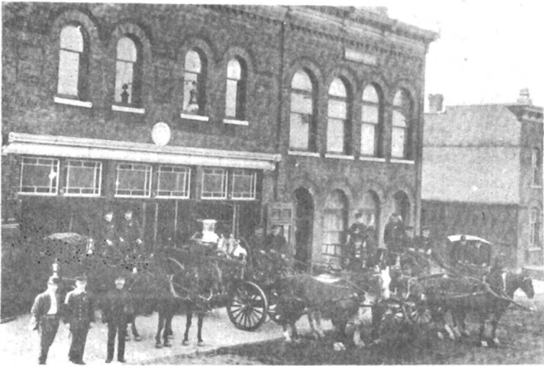
Les pompiers devant leur nouveau poste, angle Leduc et Wright, en 1911.

En quelle année avons-nous eu à Hull notre première parade des pompiers?