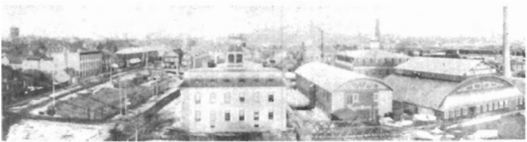
La Ville de Hull en 1900

La Cie du Tramway de Hull a prolongé son réseau jusqu'à Wrightville en 1910.