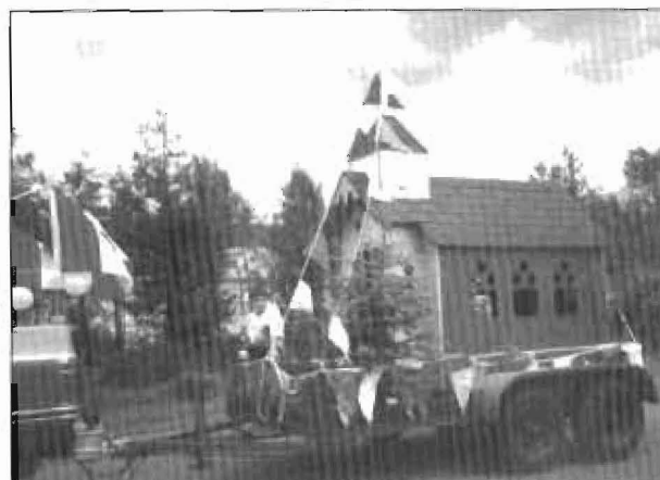
Char allégorique d'Eva Robichaud.