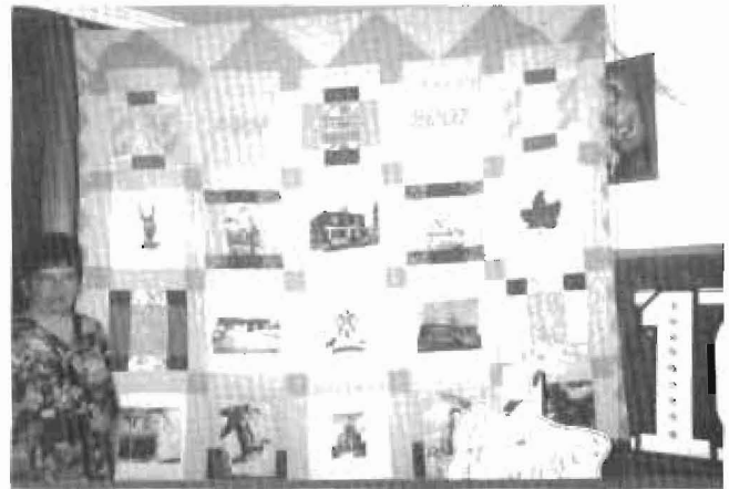
Estelle Sabourin présente la courtepointhe raflée à la Saint-Jean-Baptiste. Les fonds furent utilisés pour défrayer les coûts des festivités du centenaire.

Et le tout se termina par un délicieux buffet préparé par les paroissiens de Limoges, disposé sur les tables par une équipe de dames bénévoles sous la direction de Mme Cécile Laurin. Tous semblaient enchantés du déroulement de cette première cérémonie qui nous mettait malgré nous dans l'atmosphère des fêtes du centenaire.