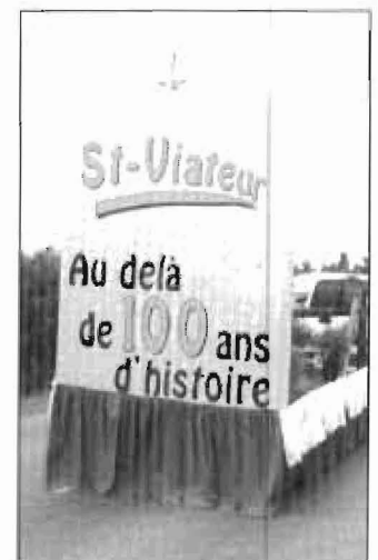
Le char allégorique du Comité du centenaire a clôturé la parade.

Puisqu'une remise de prix était décernée pour la beauté et l'originalité des chars allégoriques, trois personnes agissaient comme juges et des prix de 100$, 50$ et 25$ étaient remis pour trois catégories dont la première incluait les calèches, les chevaux et les vieilles voitures, la deuxième comprenait les chars allégoriques et la troisième s'appelait <<autres>>.