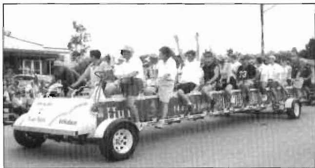
On s'amuse ferme sur le vélo-bus qui s'est classé 1er dans la catégorie "Autres".