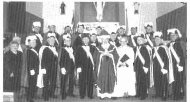
Les Chevaliers de Colomb à la messe commémorative avec Mgr Marcel Gervais le 14 janvier 2001.

Cinq enfants de la paroisse eurent l'honneur de sonner chacun 20 coups de cloche.