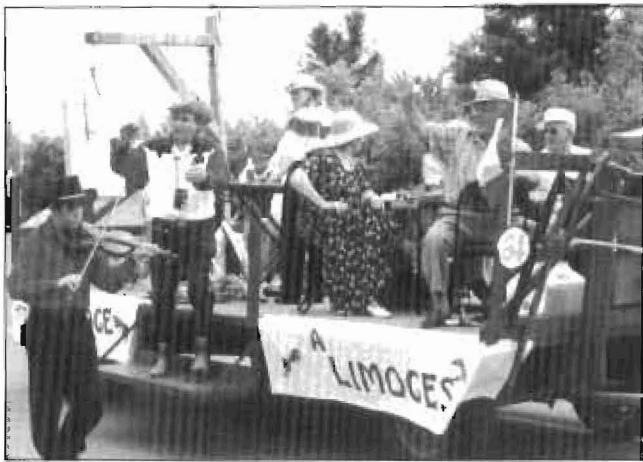
Char allégorique du Club du bonheur de Limoges.