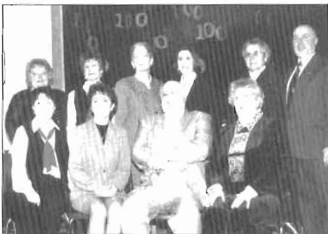
Comité du centenaire.