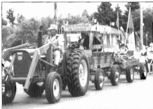
Le char allégorique du comité de citoyens a remporté un 2e prix.

Cependant, c'est la fin de semaine du 23 et 24 juin 2001 qu'eut lieu la plus importante activité de l'année, puisque le Festival du Parapluie conjointement avec le comité de la Saint-Jean-Baptiste et le comité des fêtes du Centenaire, attira plus de 8 000 spectateurs et participants.