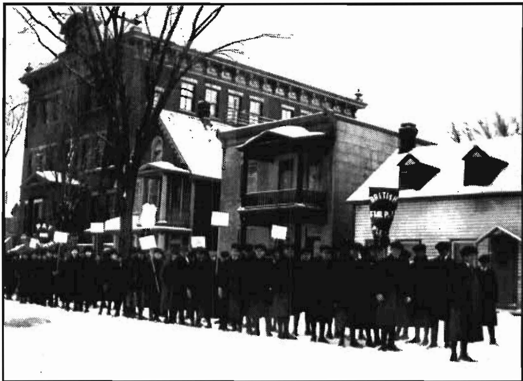
Les élèves des écoles françaises d'Ottawa – dont ceux de Guigues paradant dans les rues de la ville pour s'opposer au Règlement XVII, 1916.