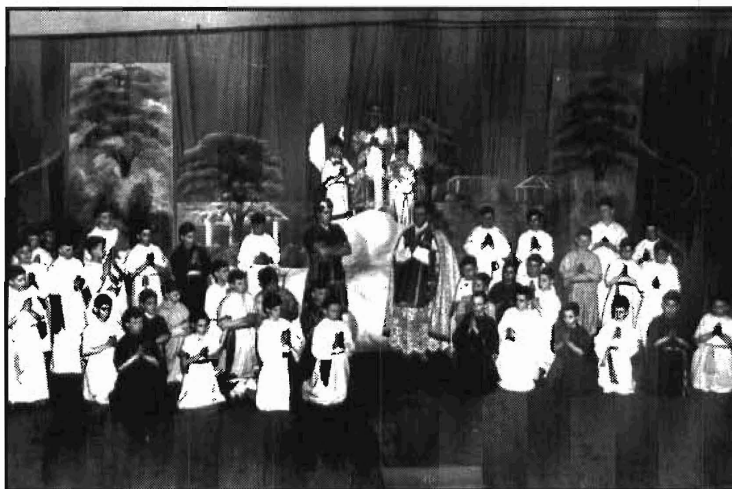
La pièce de théâtre Tarcisus présentée le 28 janvier et le 4 février 1947.