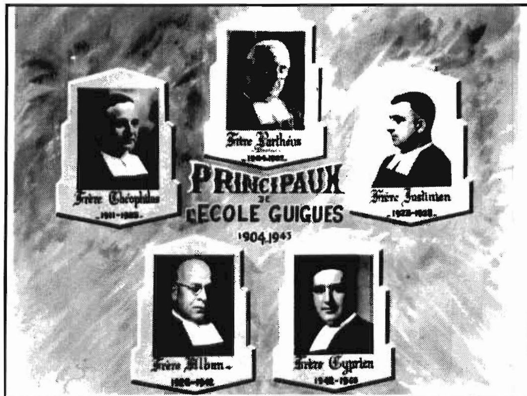
Cinq directeurs de l'école Guigues entre 1904 et 1969.