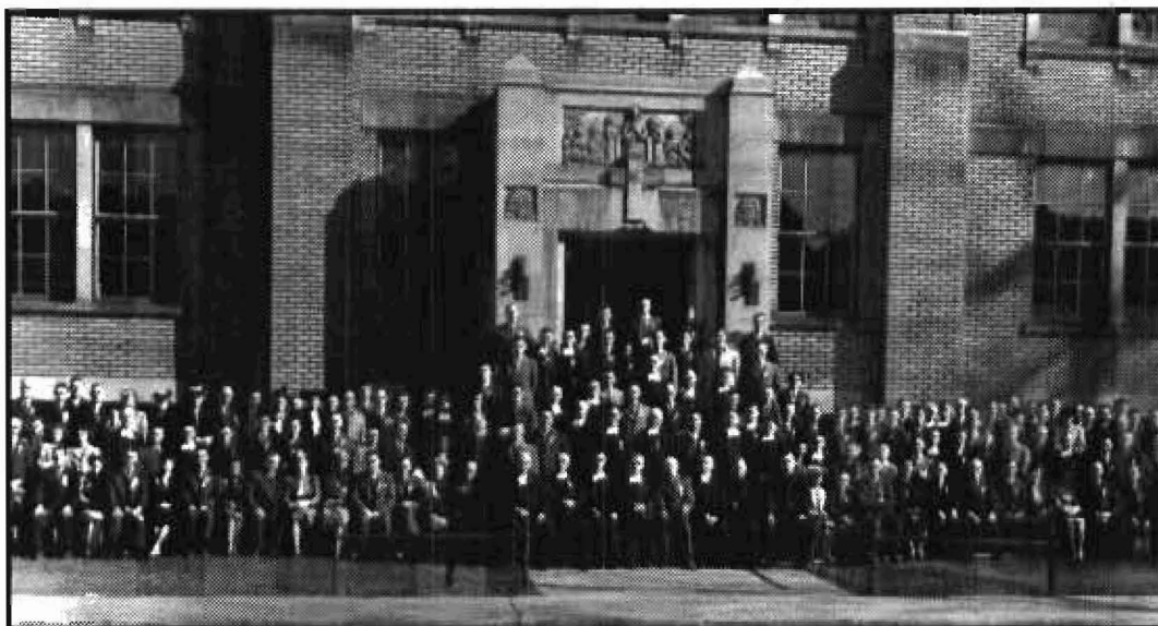
Le rassemblement à l'occasion du 25 e anniversaire de l'Amicale Guigues, Ottawa, photo prise le 15 mai 1946 devant l'école Routhier.

Photo: Normandin et Lavoie, Archives municipales d'Ottawa, ca-19350