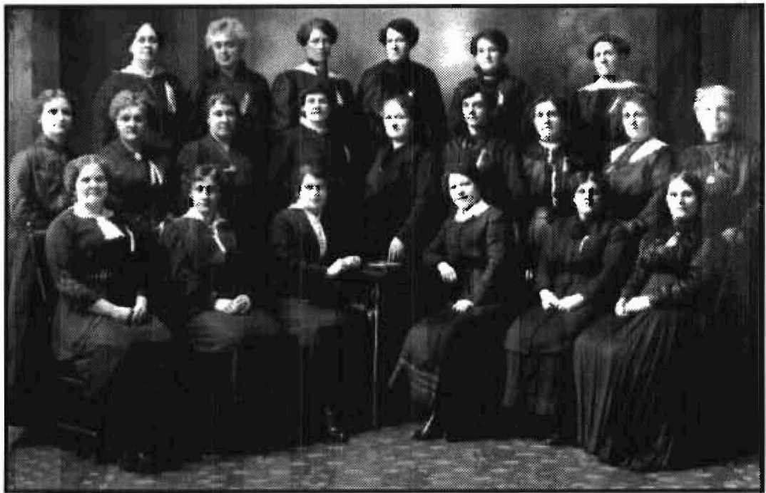
Les femmes «gardiennes de l'école» au temps du règlement XVII, 1916.