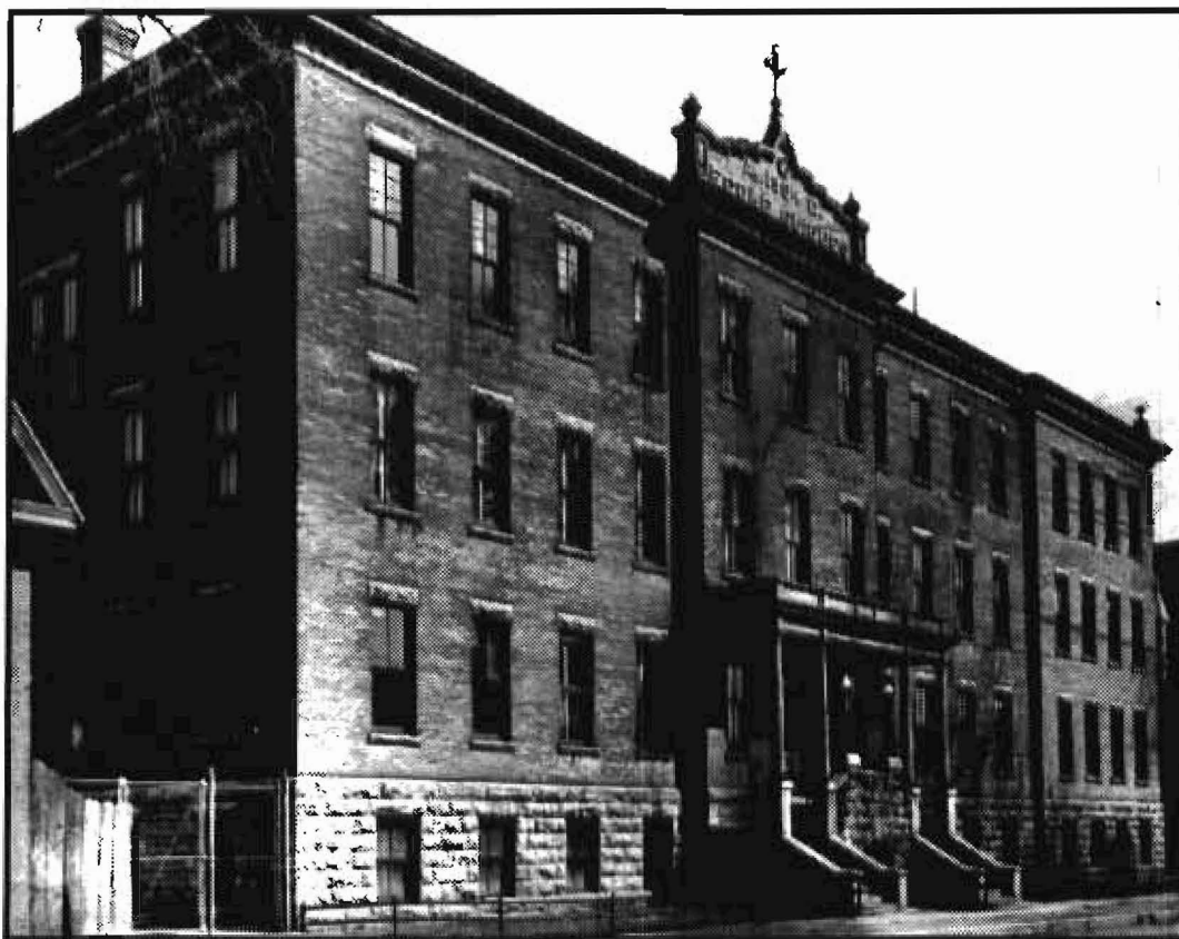
L'école Guigues, vers 1950. Archives municipales d'Ottawa, ca-19355