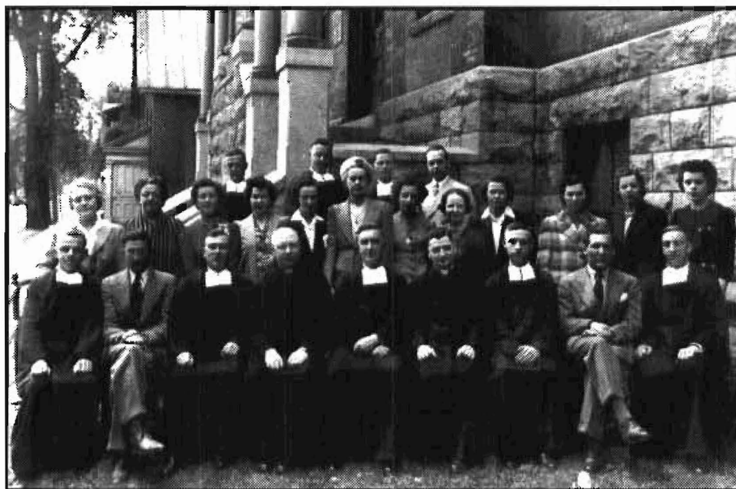
Le personnel enseignant, 1942-1943.