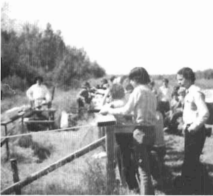
Un "tir au dindon"