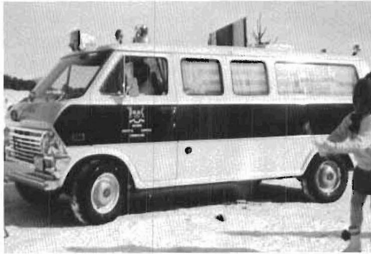
Le service d'ambulance de Noëlville (1971) lors d'un carnaval d'hiver