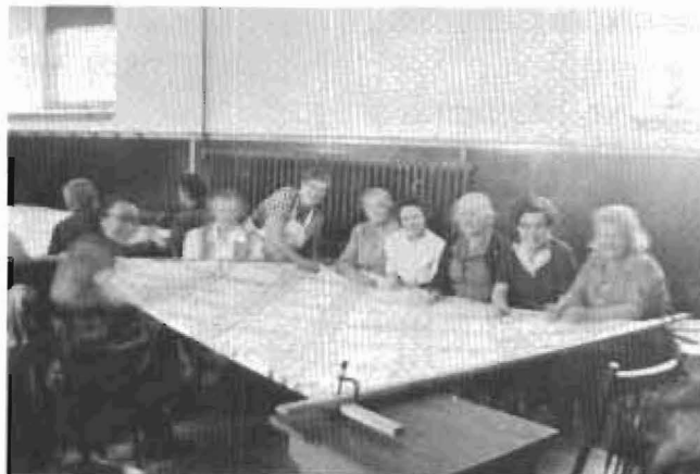
Un "bee" de couvre-pied (1951)