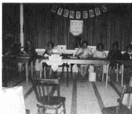
Dixième Anniversaire du Cercle