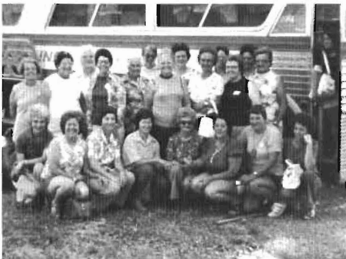
Voyage en Gaspésie en août 1976

Echange culturel entre le Cercle des Fermières du Québec et l'Union Culturelle de Noëlville et le club Fraternité de Sudbury. En août 1977, nous recevons la visite des Gaspésiennes.