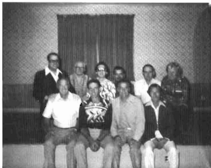
OFFICIERS POUR 1979 - 1980