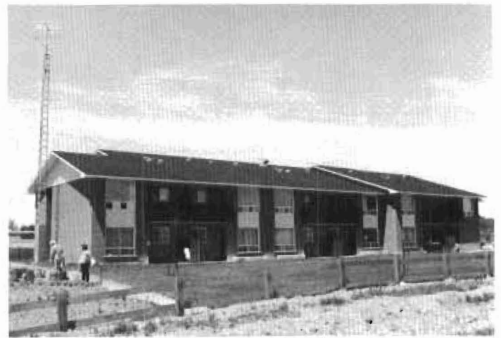
Côté est de la résidence

OUVERTURE DE LA RESIDENCE DES PIONNIERS - 21 juin, 1977