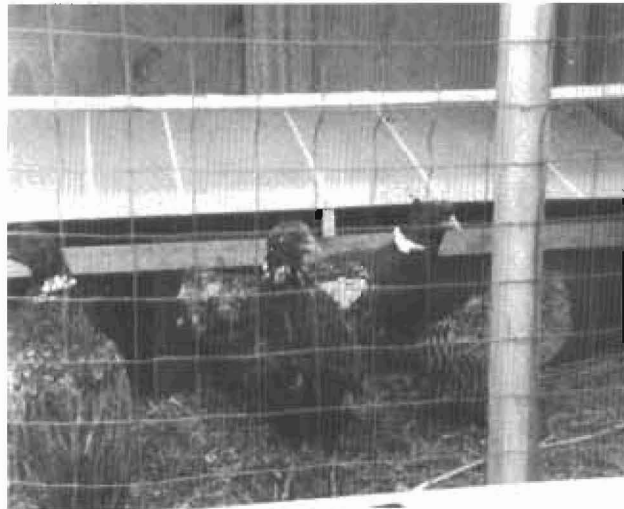
L'élevage des faisans