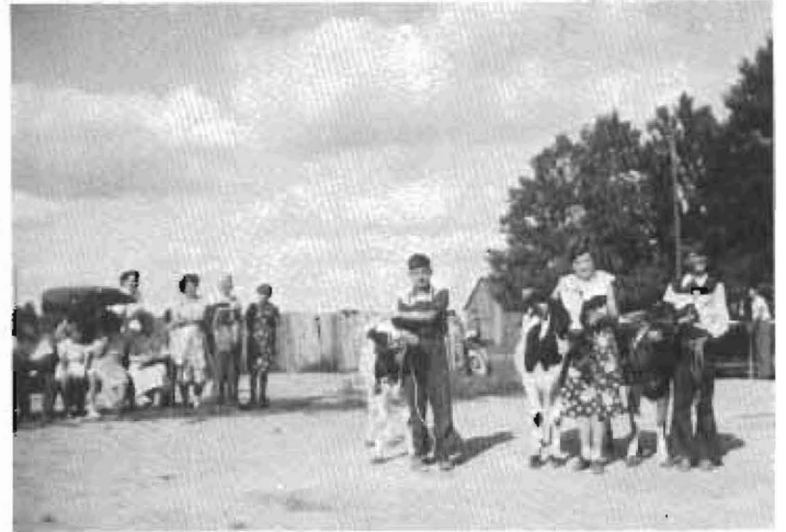
Quel choisir comme gagnant?... Le choix est certes difficile!