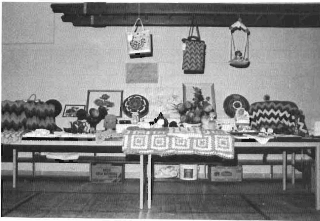
Une exposition d'artisanat du Club 60 de Noëlville