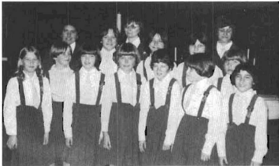
Les Jeannettes - 1978-1979