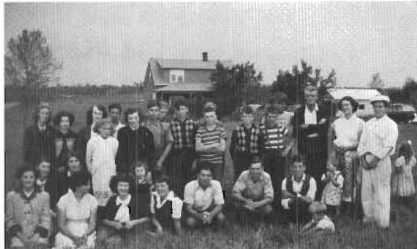
Une rencontre du club 4-H