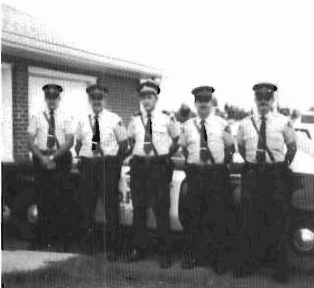
Ontario Provincial Police officers at Noelville Detachment taken August 21, 1979, standing left to right -