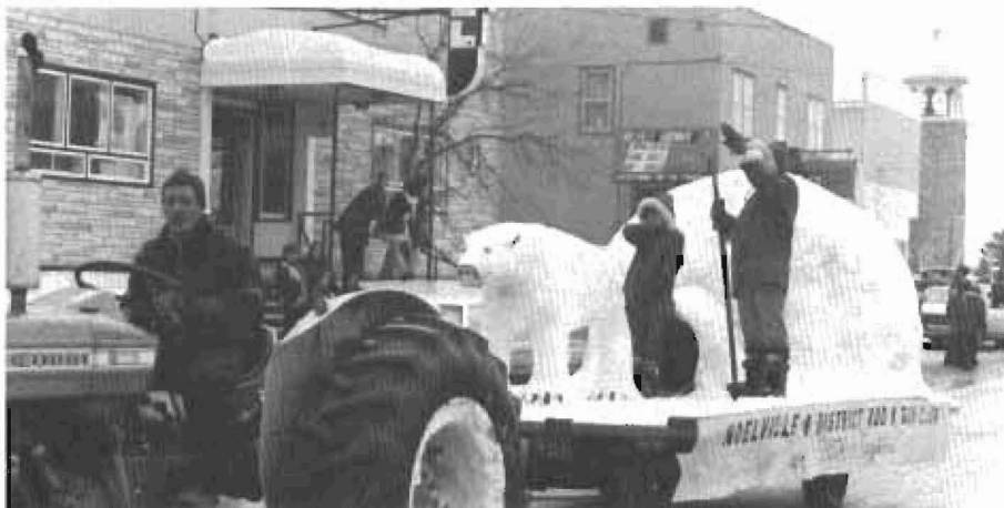
Char allégorique du club "Rod and Gun" lors d'un carnaval d'hiver