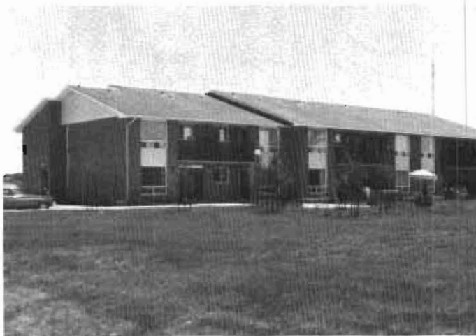
Côté ouest de la résidence