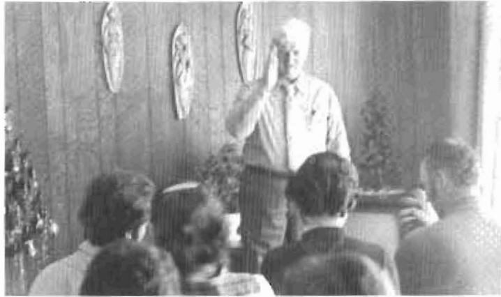
Bénédictio d'un père de famille lors du Jour de l'An 1973