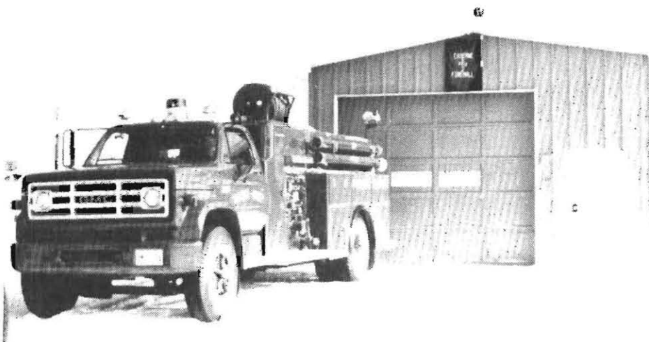
Caserne et camion, secteur de Harty.