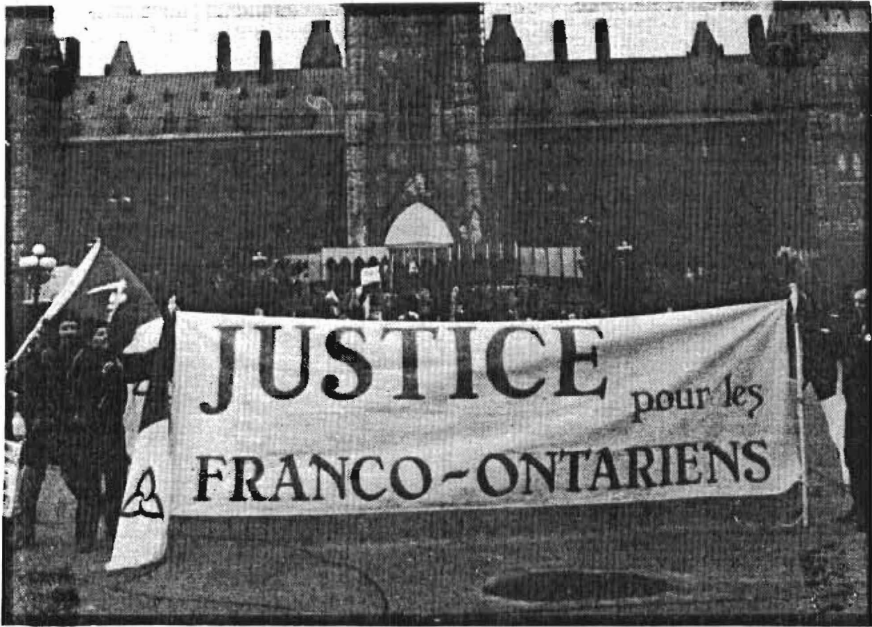
le 26 février 1981, les Franco-Ontariens manifestent devant le Parlement d'Ottawa.