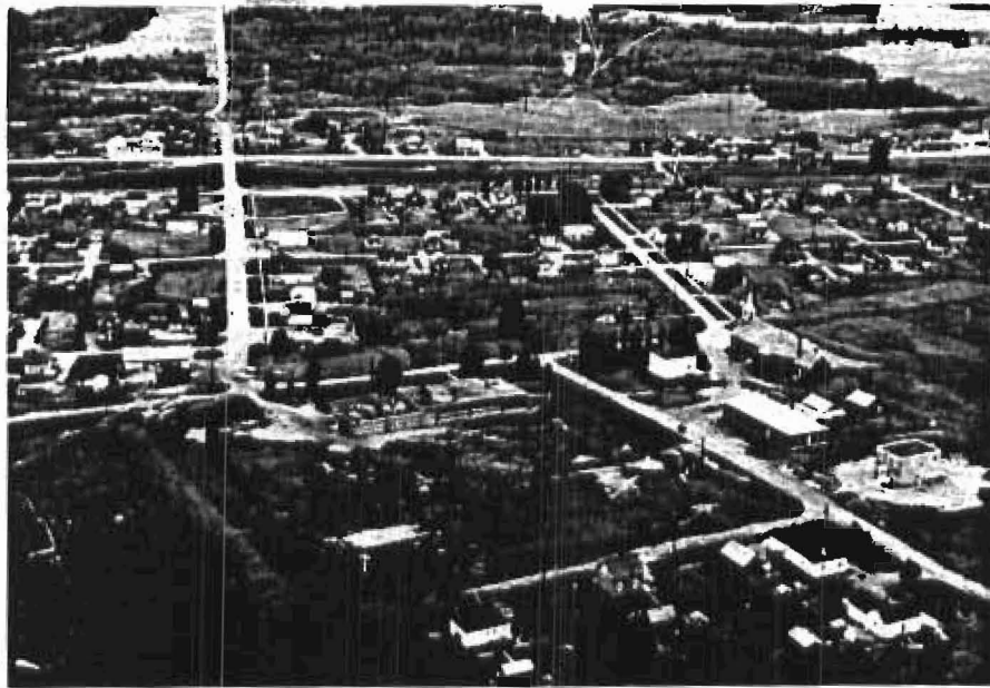
Le village de Fauquier vers 1960

définissent la propriété foncière de chacun. Donc, la nomenclature du terrain familial peut se décrire ainsi: Terrain : subdivision 12-8; Lot : 28; Concession : I; Canton : Machin; Municipalité : Fauquier; Comté : Cochrane.