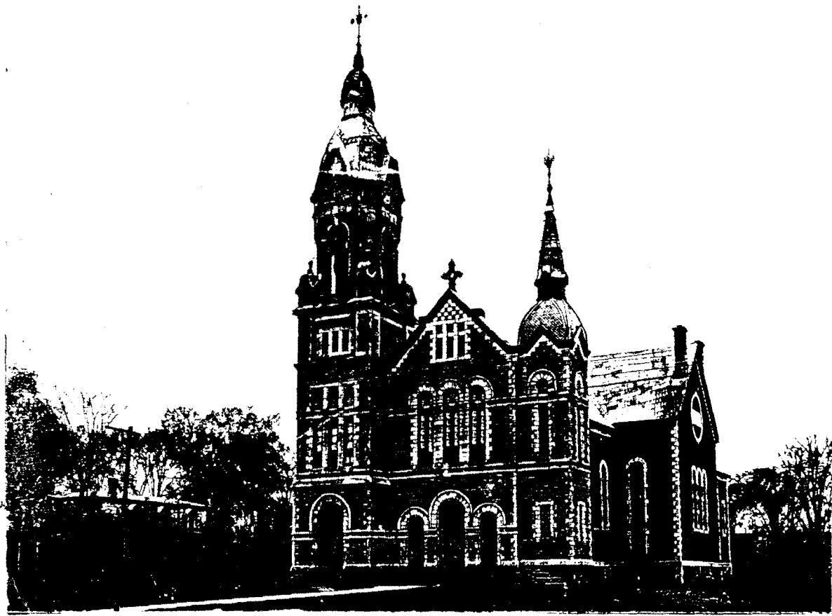
Première église en 1897