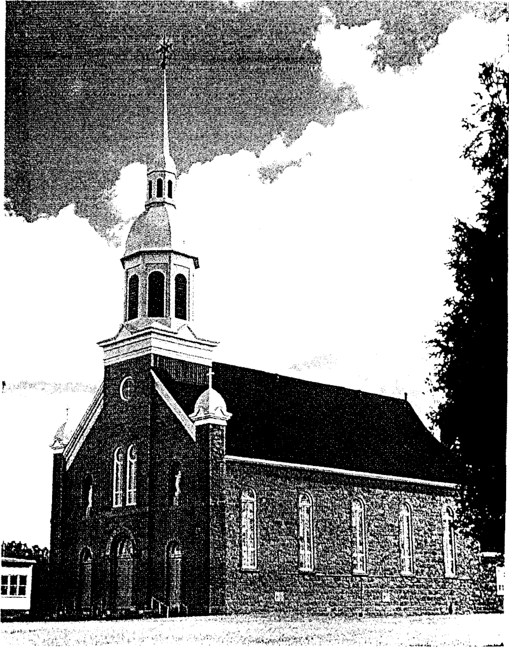
Saint-Bernard, Fournier (1867)