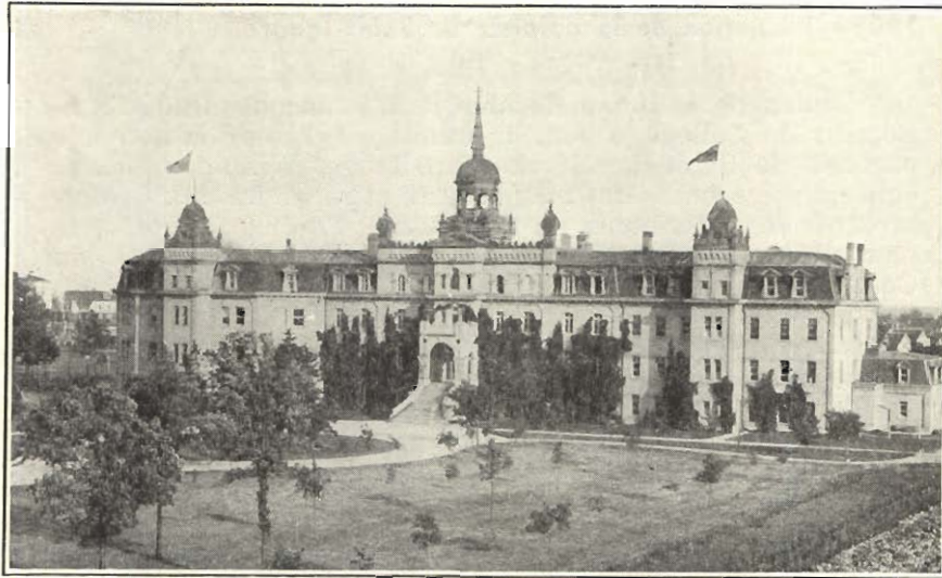
Ancien Collège de Saint-Boniface.