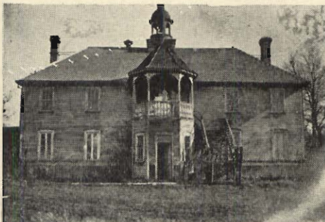
Ancienne Académie Provencher.

fidèles de cette ville, voulant remplir une des conditions exigées par le Souverain Pontife pour se procurer la grâce du jubilé, firent en faveur de la Rivière Rouge une collecte qui s'éleva à la somme de 364 louis (environ $2,000.) et qui devait être employée à fonder une école. (Dom Benoît, I, 290)